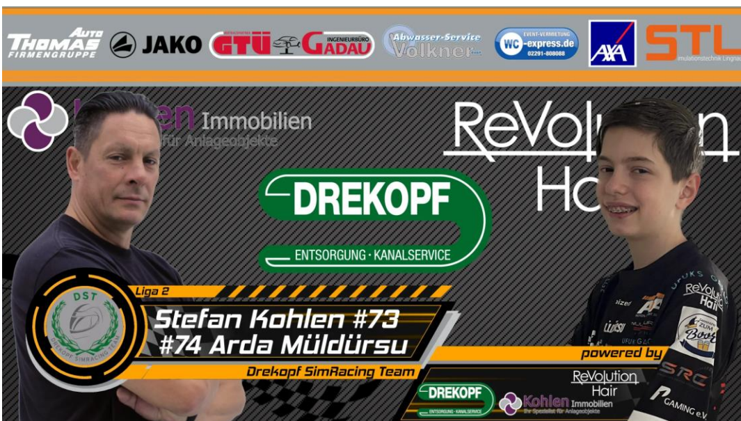
Arda Müldürsu startet diese Saison in Liga 2 mit dem Team Drekopf.